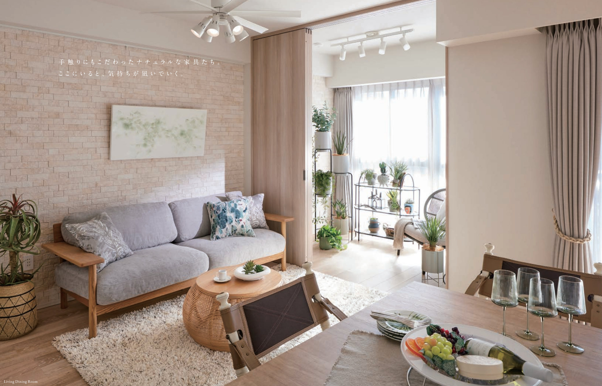
Living Dining Room