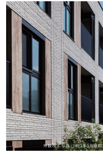
外観竣工写真(2023年9月撮影)