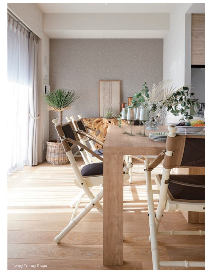
Living Dining Room