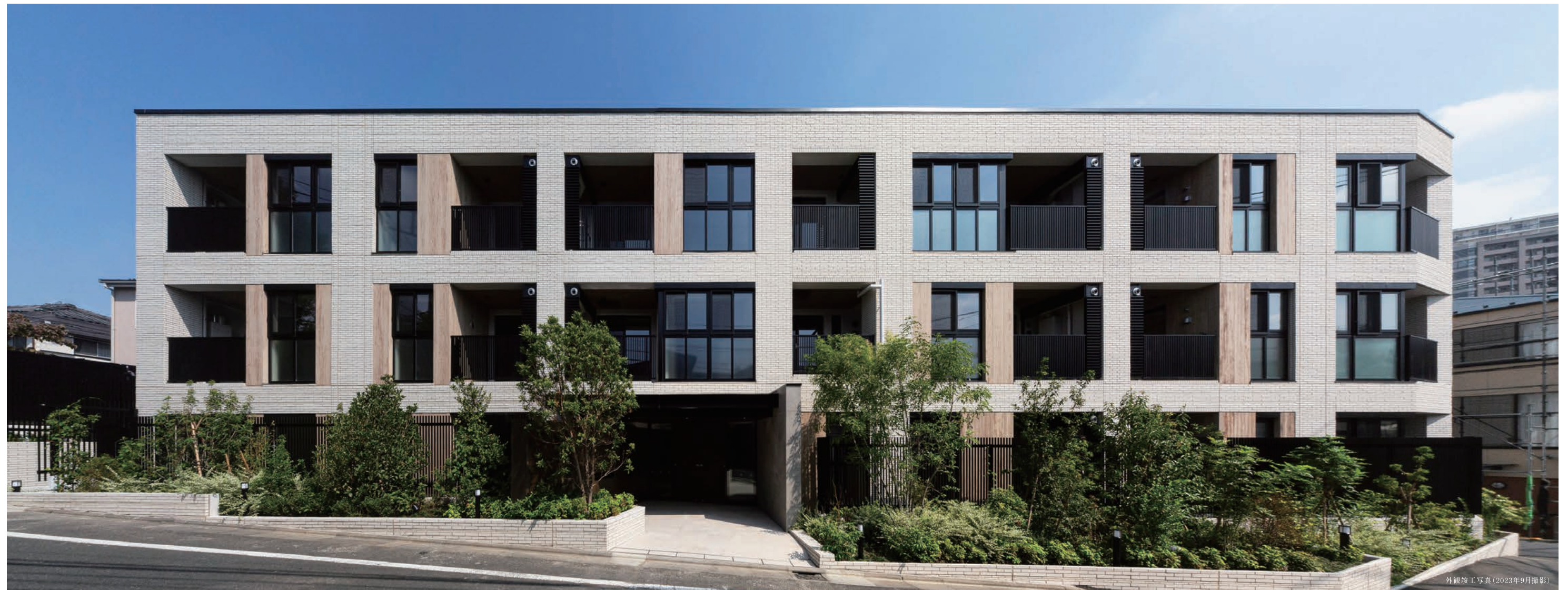
外観竣工写真(2023年9月撮影)