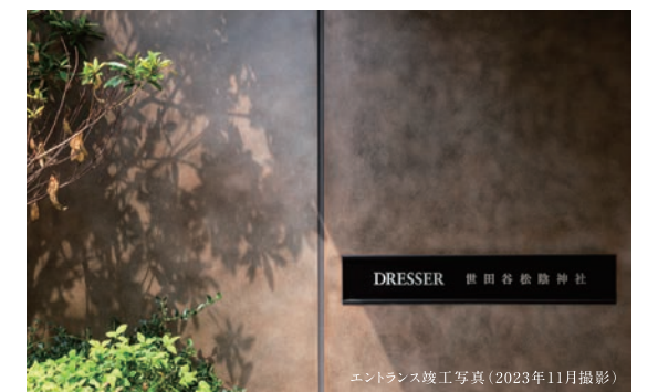
エントランス竣工写真(2023年11月撮影)

エントランスには、斜めに配したウォールによる開かれた構えと、木調のオートドアや前庭の木立による見えがくれの美を。格調高い鋼板と大判タイルを外から内へ連続させた風除室の先には、素材と光の演出で魅せるエントランスホールを配置。要素を引き算することで生まれた端正なシークエンスが、建物に宿る美意識を語りかけてきます。