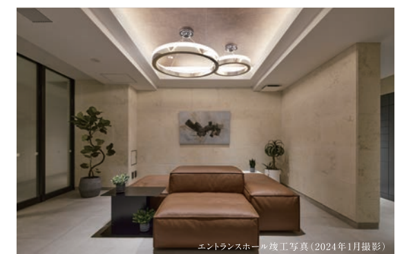
エントランスホール竣工写真(2024年1月撮影)