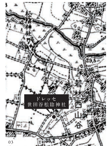
01.松陰神社(現地より約470m/徒歩6分) 02.現地周辺の街並み(現地より約590m/徒歩8分) 03.若林付近の地図(明治42年測図) ※掲載の環境写真は2023年8月に撮影したものです。距離表示については地図上の概算距離を算出したもので、徒歩1分=80mとして算出(端数切り上げ)しています。