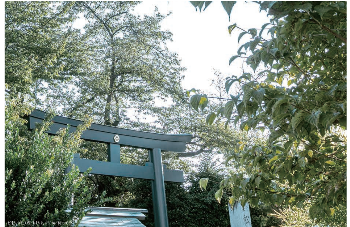
松陰神社(現地より約470m/徒歩6分)

歴史ある松陰神社の森から滲み出す涼として穏やかな空気を背景に、 格調高い街並とここにしかない生活文化が煌めく街。 この地に住まいを創造するにあたり、私たちは、街の本質に通じるIDENTITYをテーマとしました。 端正な建築と多彩な空間に、住まう方の個性に染まる美と質を積み重ねて—。 “自分らしさを極める上質なレジデンス”を、今ここに。