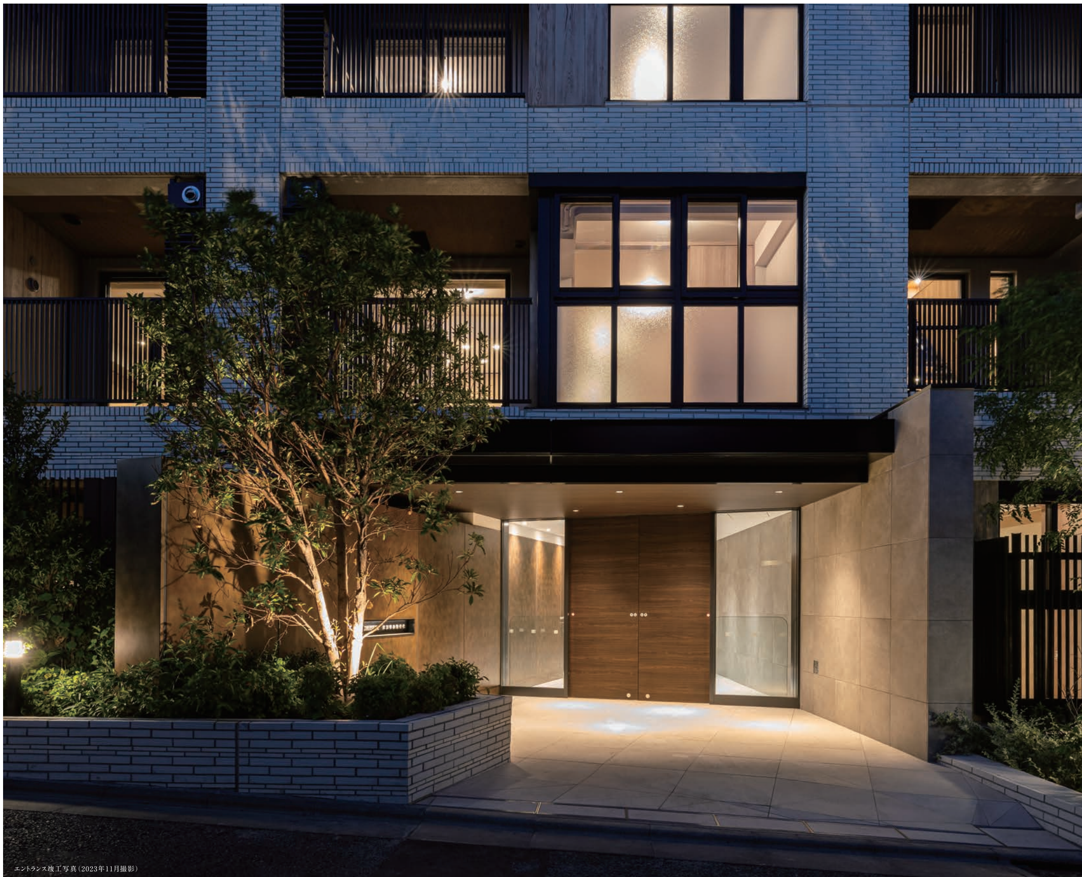
エントランス竣工写真(2023年11月撮影)